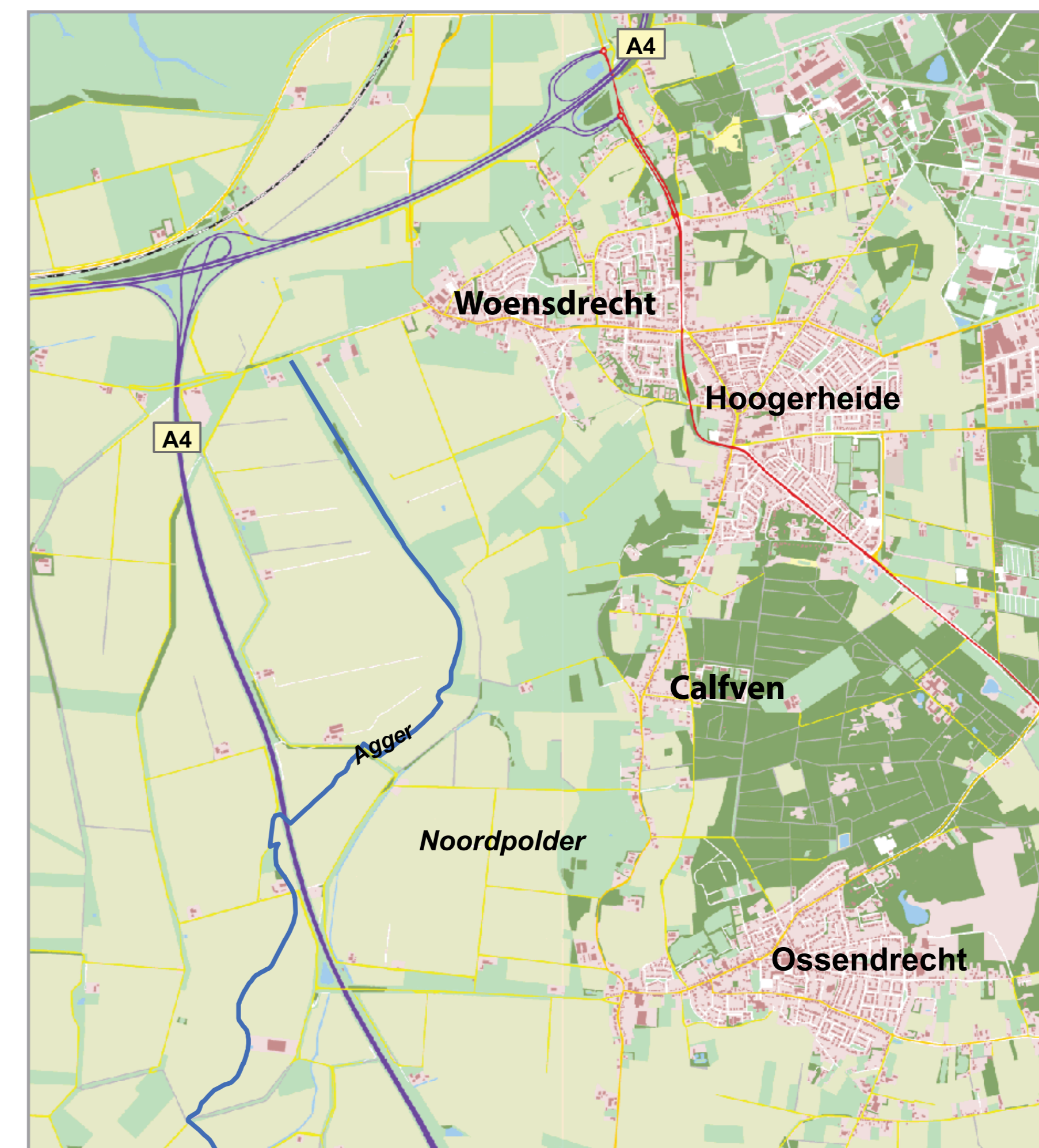
Overzichtskaart huidige situatie.